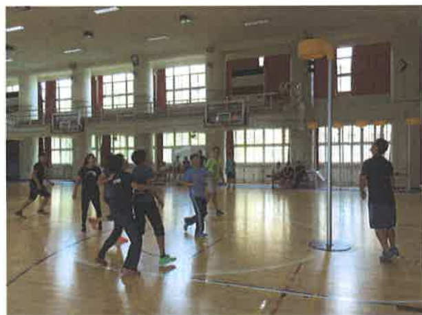
圖說：合球比賽剪影