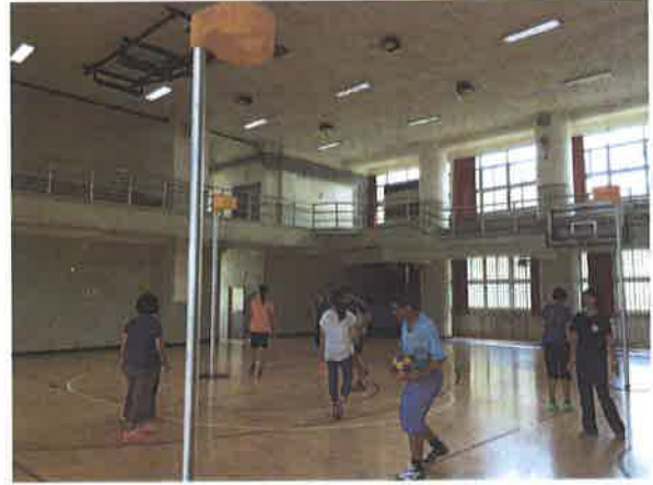
圖說：合球罰球動作練習