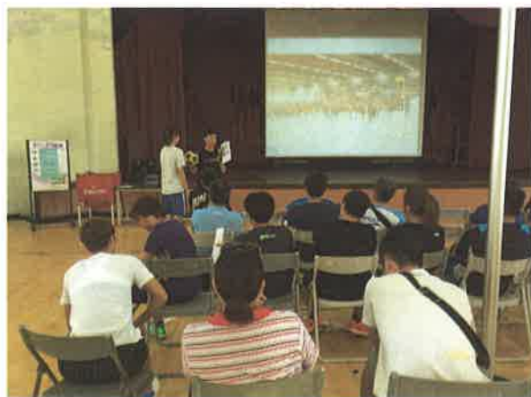
圖說：合球規則案例說明