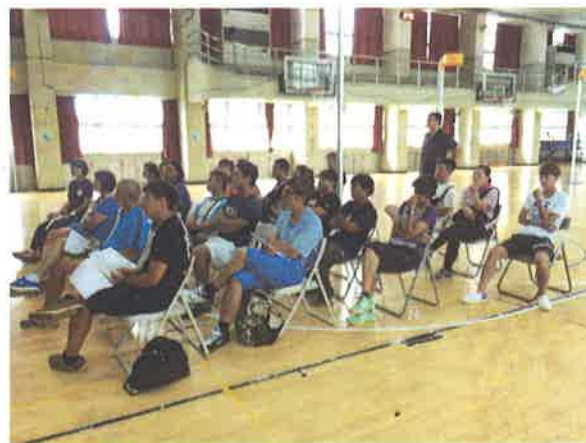
圖說：研習人員剪影