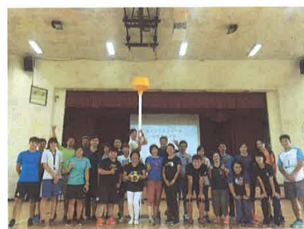
圖說：研習人員合照