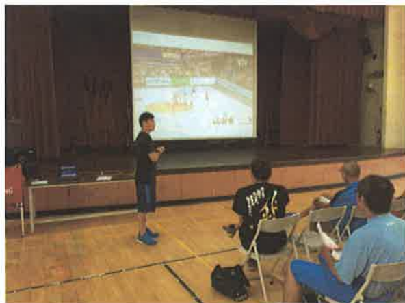
圖說：合球規則案例說明