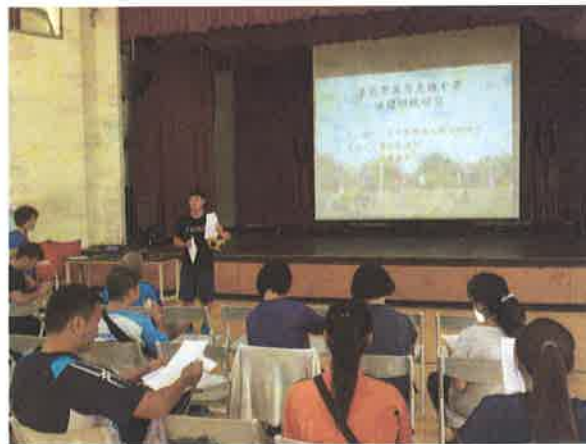
圖說：合球規則說明