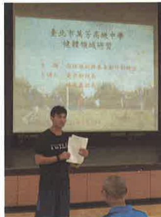
圖說：合球規則案例說明