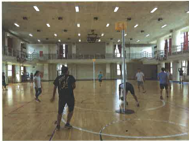
圖說：合球分組投籃練習