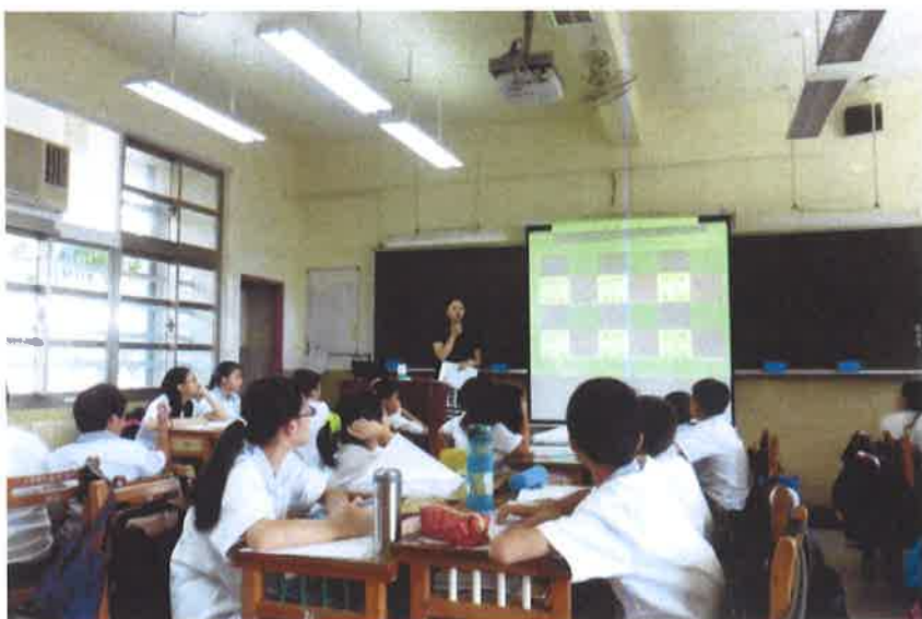
第四次共備照片(105/10/6)—公開觀課