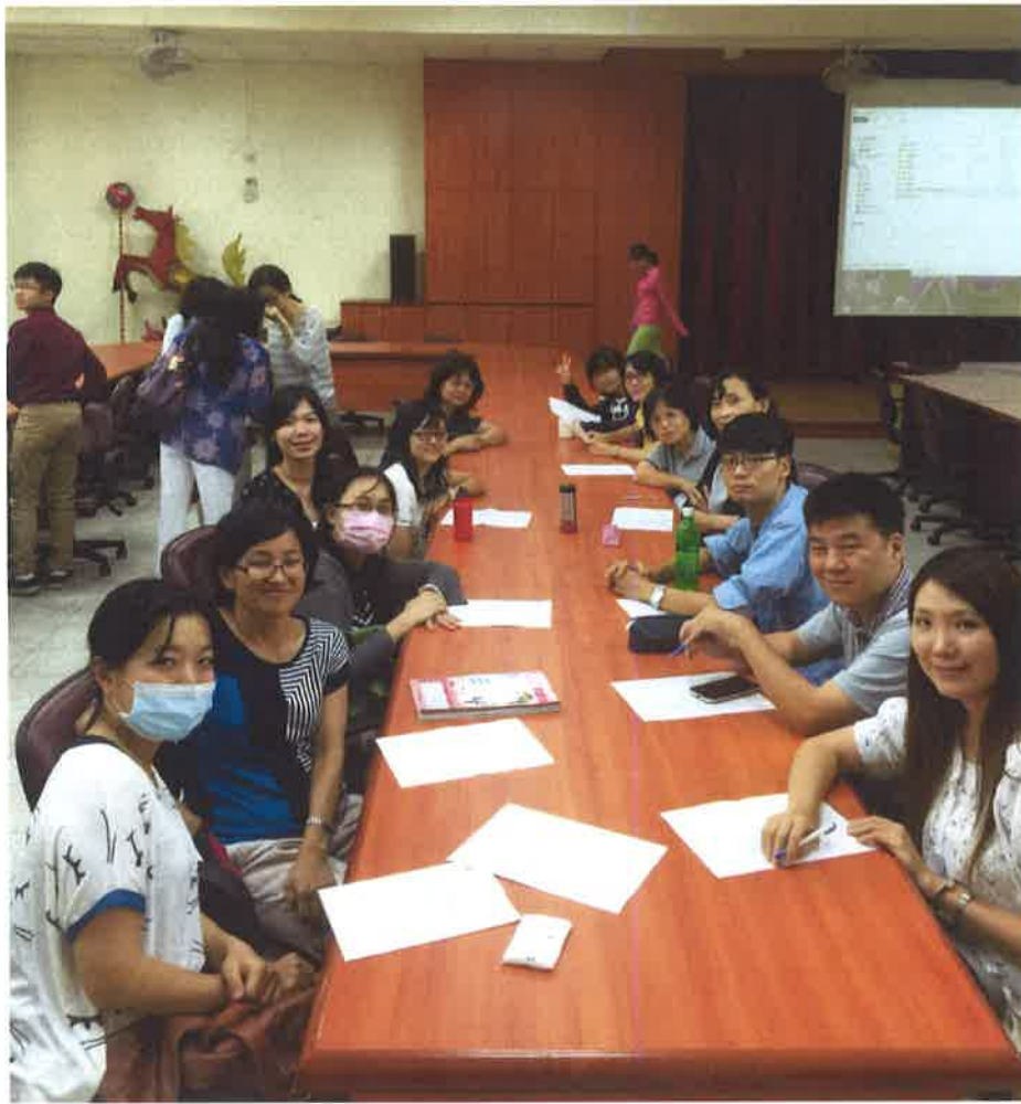
第五次共備照片(105/10/20)——景興國中共備發表