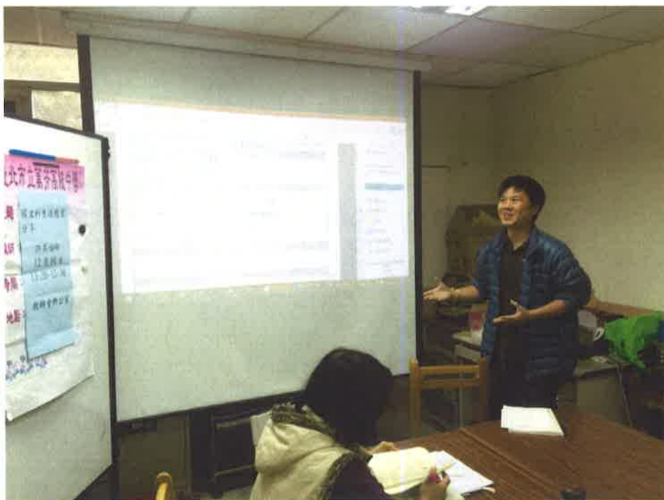
第七次共備照片(105/12/8)——生涯教案分享