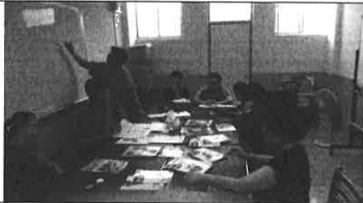
圖說：教科書版本討論與票選