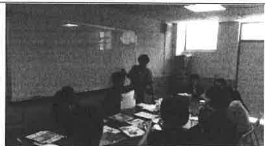
圖說：教科書版本討論與票選