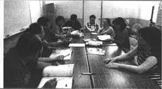
圖說：試題分析實況