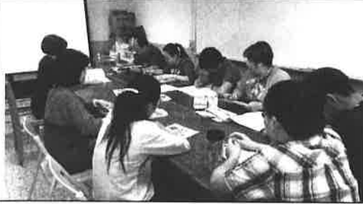
圖說：試題分析實況