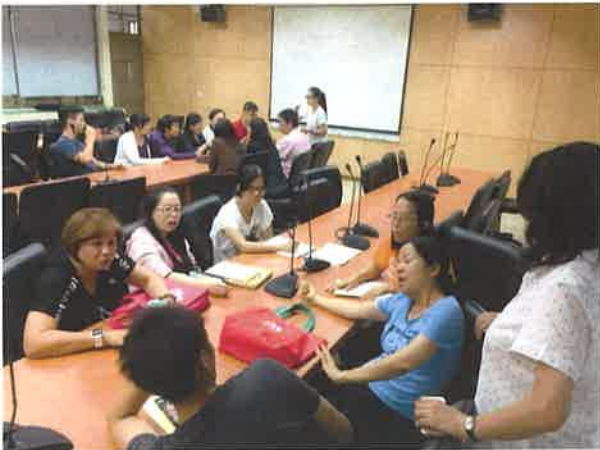
主任及教師共同討論