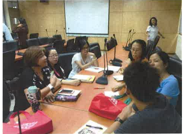
老師討論相關議題