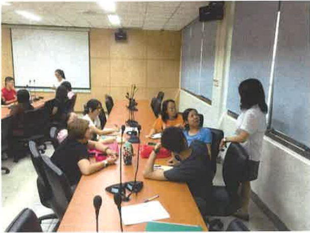
主任叮嚀本學期應注意事項