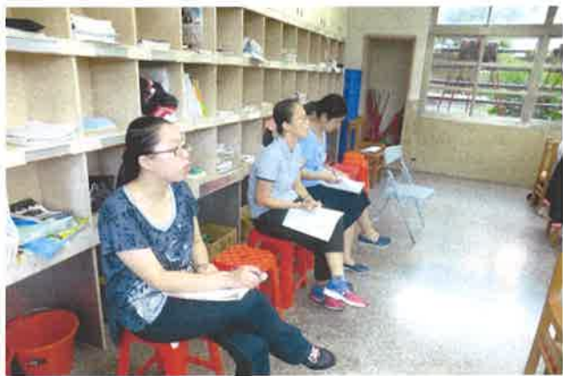
數學科教師進行觀課