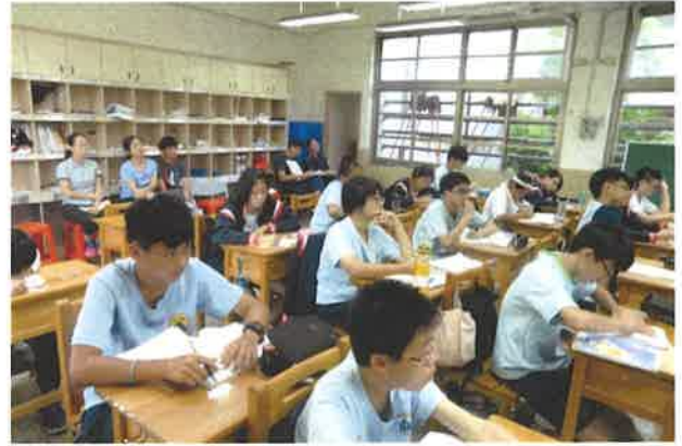
公開觀課-學生上課情形