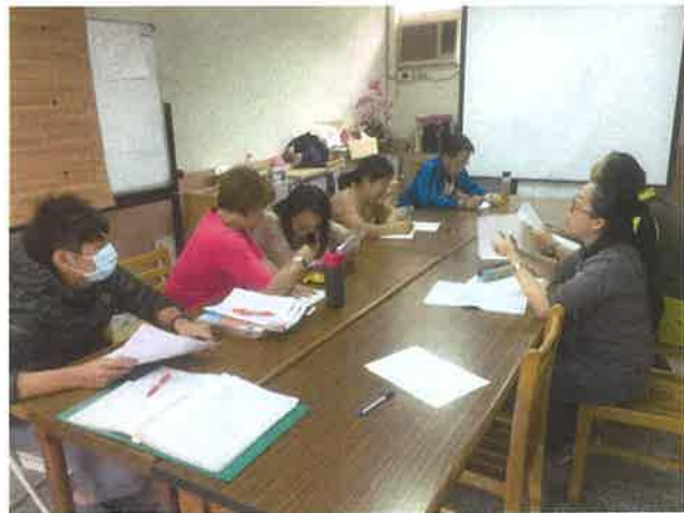
第一次定期考試題分析(二)