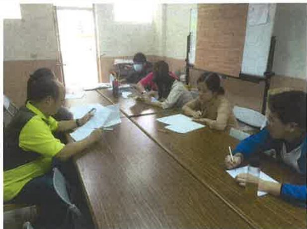
第一次定期考試題分析(一)