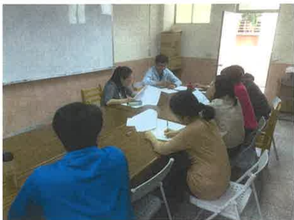
分析學生學習狀況