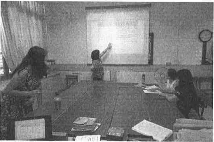
圖說：期末個別成績單製作方式說明