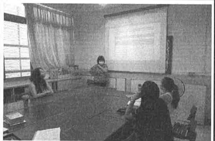
圖說：學生 IGP 如何完整建立檔案說明