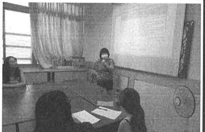
圖說：期末工作總結