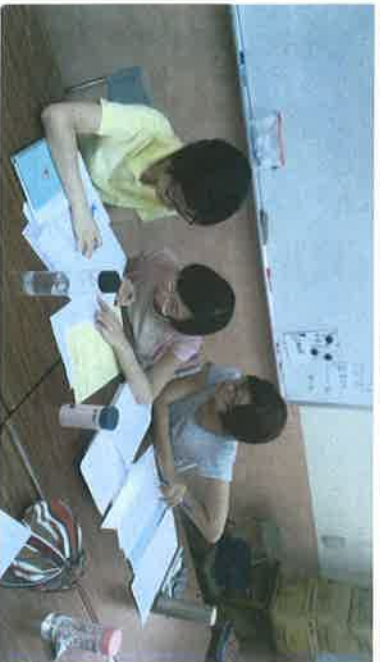
▶ 分科討論 (地理)