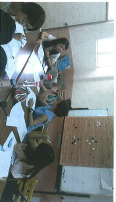
▶ 分科討論 (公民)