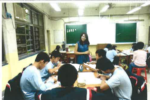
▲ 公開觀課教學現場