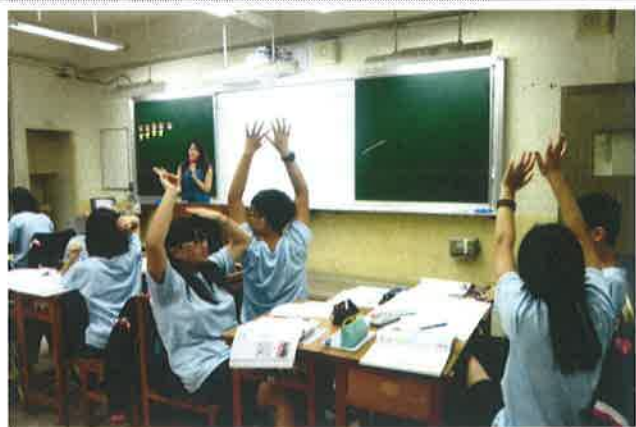
▲ 公開觀課教學現場