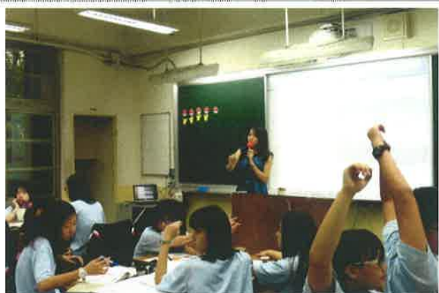
▲ 公開觀課教學現場