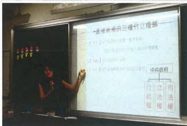
▲ 公開觀課教學現場