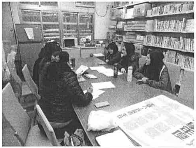
圖說：確定公開觀課教師