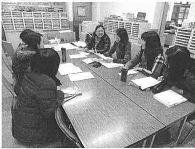
圖說：技職教育相關資訊討論