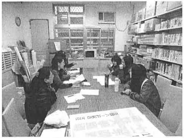
圖說：確定共備時間