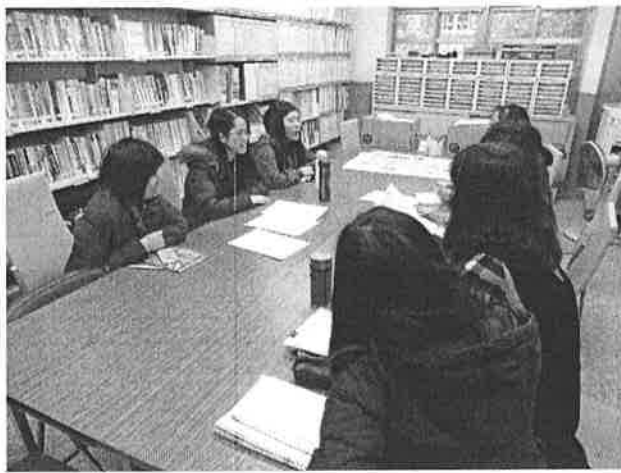
圖說：配合學校經費討論研習主題