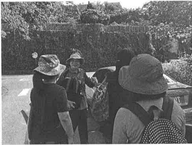
圖說：140 高地深度解說