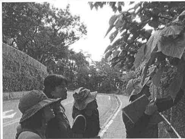
圖說：140 高地深度解說