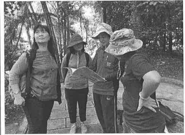
圖說：140 高地深度解說