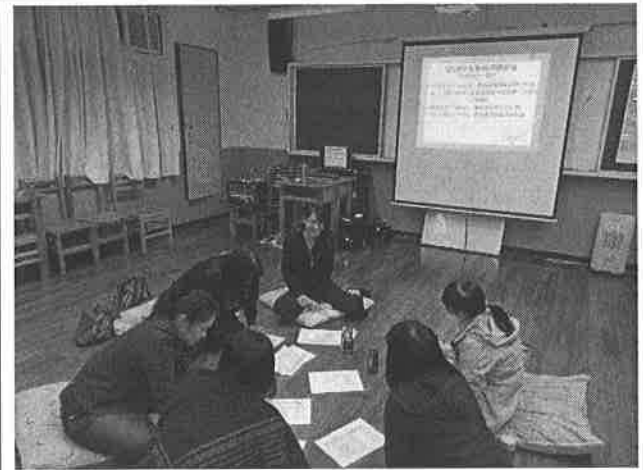
圖說：課程評鑑討論