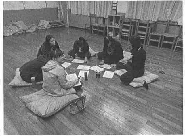
圖說：課程評鑑討論