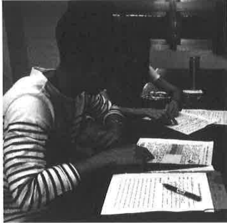
圖說：討論教學檔案所需內容