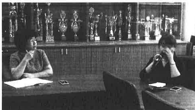
圖說：校長與行政同仁報告本學期學校目標與請許