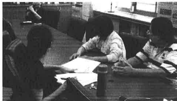
圖說：領域老師認真聽講