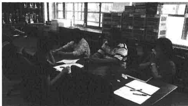
圖說：行政與老師彼此討論