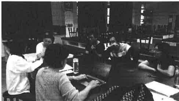
圖說：討論並評選 106 年度使用的教科書版本