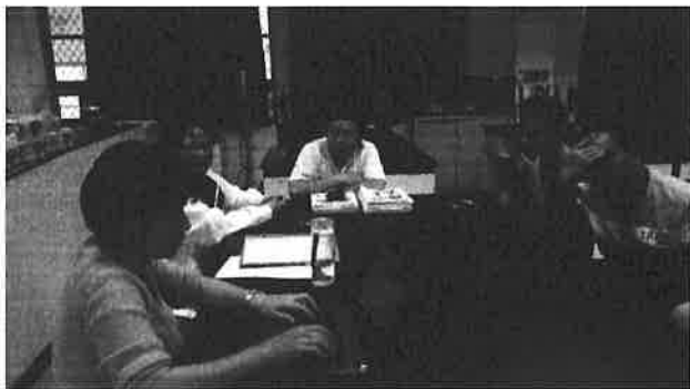
圖說：討論 106 年度課程時數