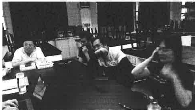
圖說：討論並評選 106 年度使用的教科書版本