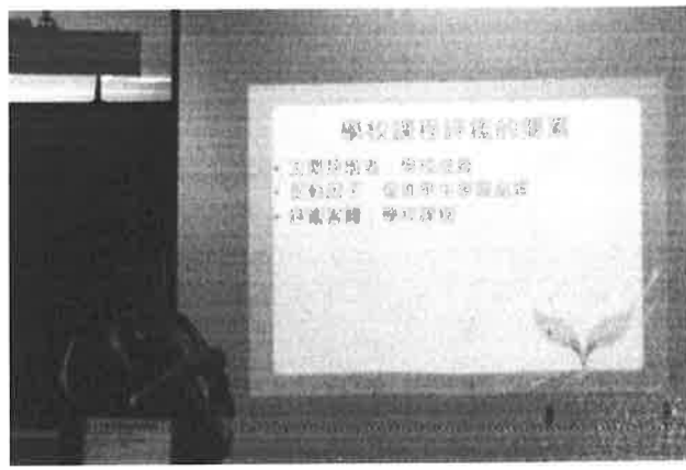
圖說：說明課程評鑑計劃