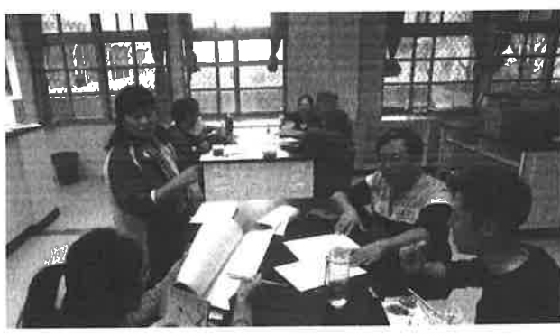
圖說：分組討論量化結果