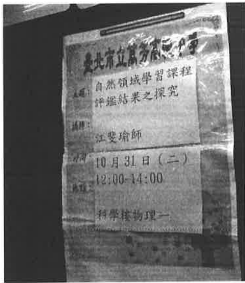
圖說：領域會議實施海報