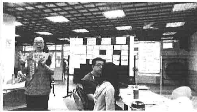
圖說：講師說明總綱