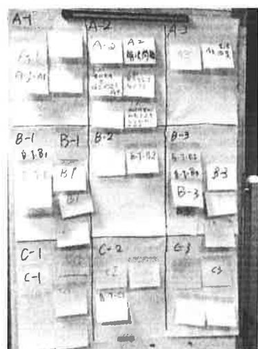
圖說：自然領域核心素養導讀與小組討論