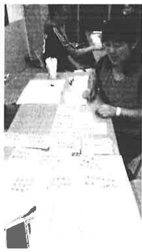
圖說：小組討論新課綱實施學校的準備