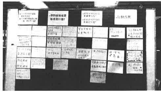
圖說：共備討論結果