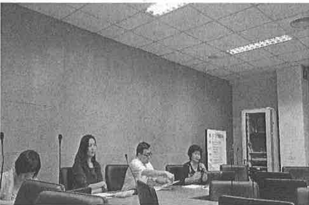
圖說：校長重點說明