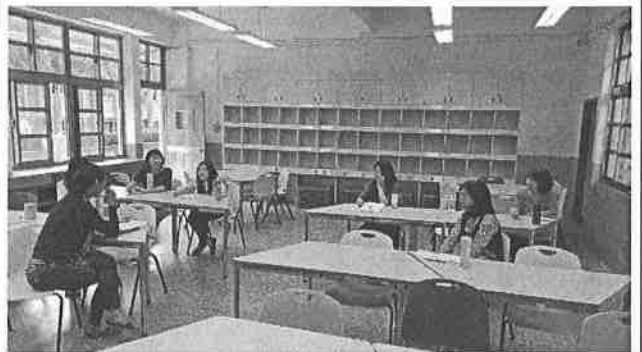
圖說：彈性課程設計