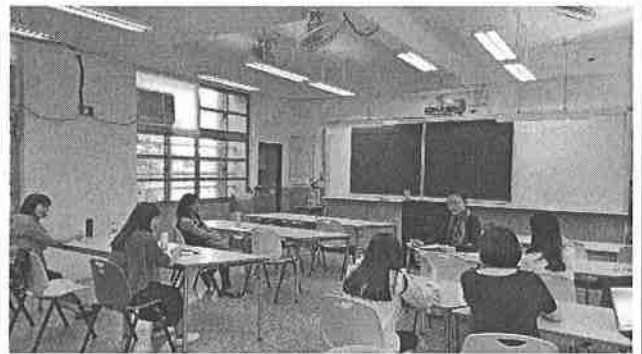
圖說：兩班三組差異化教學討論