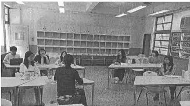
圖說：彈性課程設計