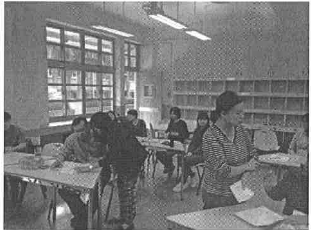
圖說：討論彈性課程