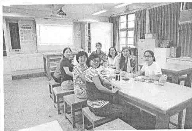
圖說：分享育才中學[每人一課表]的大考配套系統，可作為大學聯考改革的參考