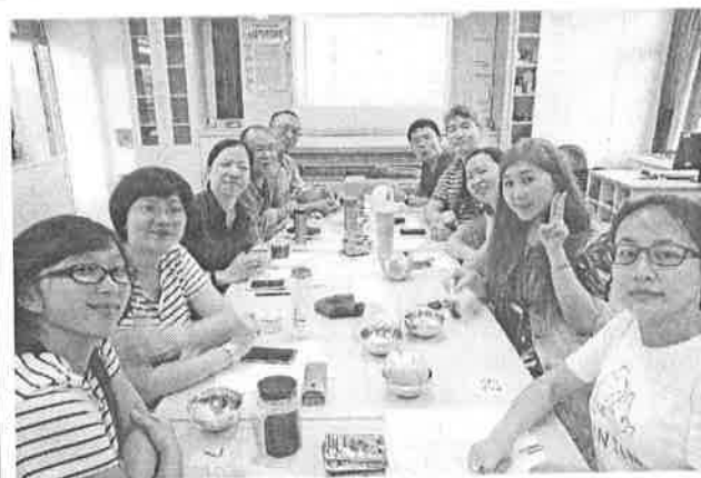
圖說：研習分享、共備討論後合影