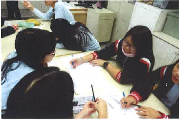
圖說：學生認真討論