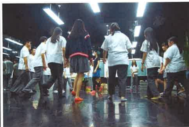
圖說：羅馬尼亞傳統舞蹈基本舞步教學