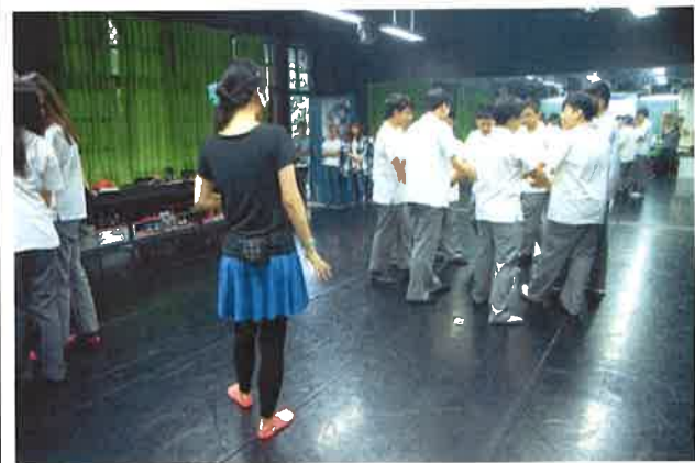
圖說：進階舞步團體圍舞分組教學