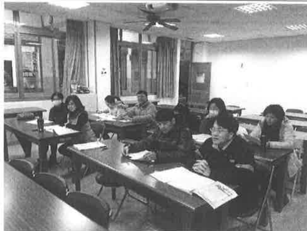
圖說：討論教學設備需求