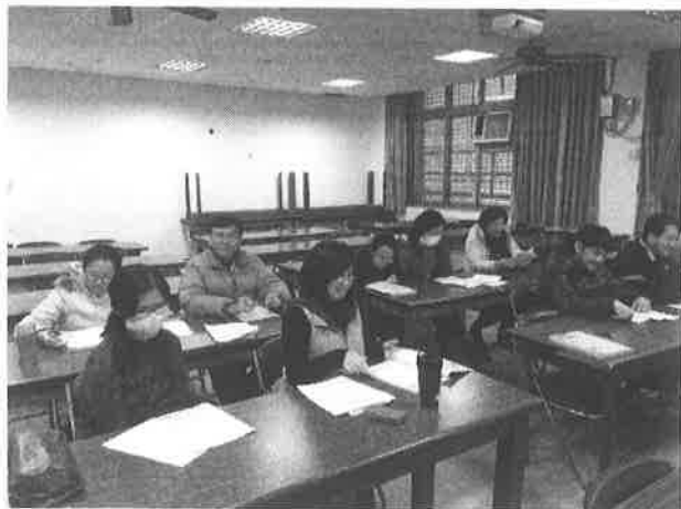
圖說：生涯融入教學教案分享