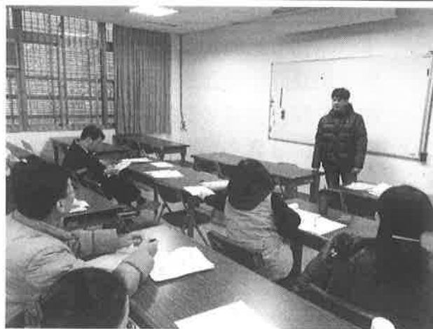
圖說：新進教師自我介紹