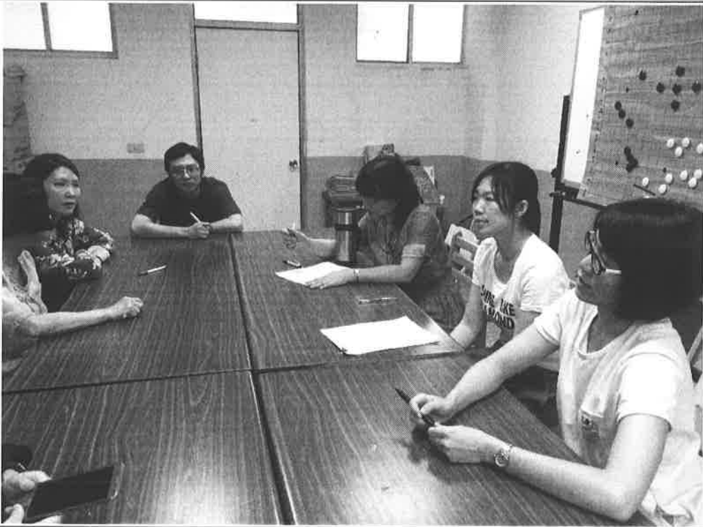
圖說：生涯教育融入教學教案 分享