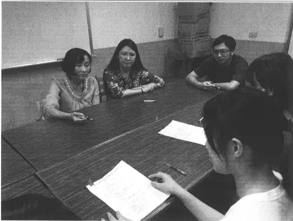
圖說：生涯教育融入教學教案 討論與回饋