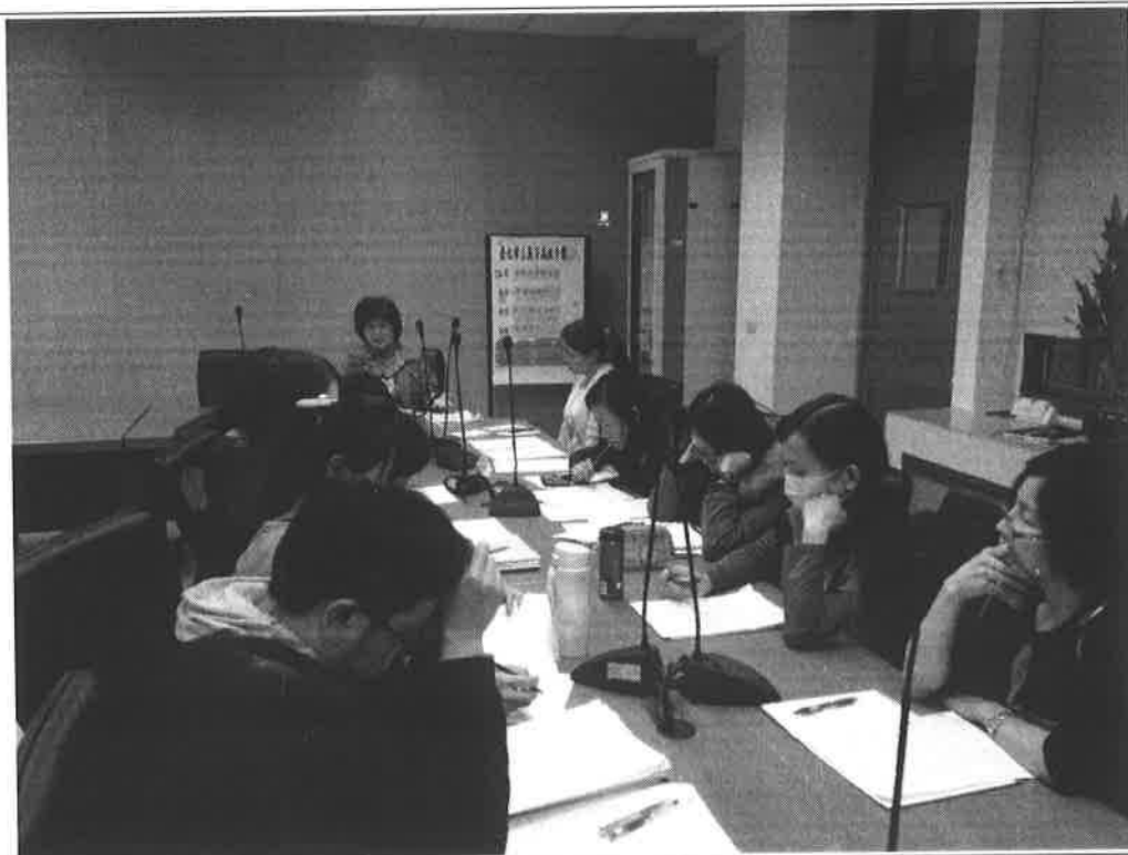
圖說：校長與領域一起討論如何強化作文教學