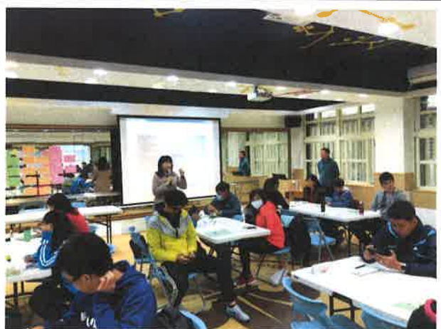
圖說：林校長勉勵各校師長