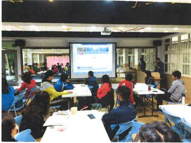
圖說：健體領域輔導團說明