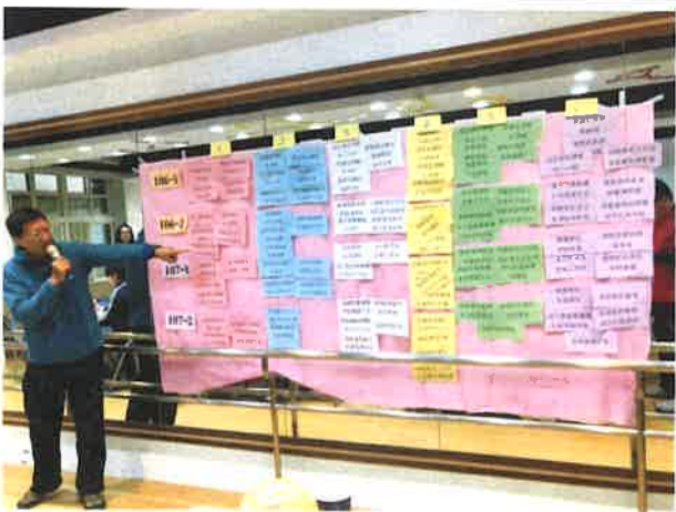
圖說：研習活動剪影