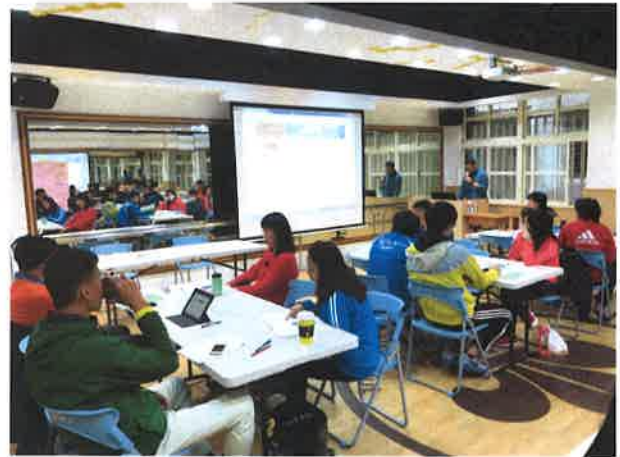
圖說：健體領域輔導團說明