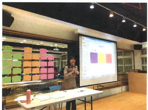
圖說：輔導團林校長 108 課綱說明